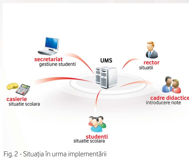
Fig. 2 - Situația în urma implementării

universității a condus către o eficientizare rapidă și vizibilă a tuturor aspectelor legate de gestionarea datelor personale ale studenților și situațiilor școlare ale acestora. La nivelul casieriiilor sistemul a demonstrat o gestionare și evidență mult mai facilă și mai coerentă a tuturor plăților efectuate de către studenți, încasări de taxe, precum și listarea automată a chitanțelor în momentul înregistrării lor.